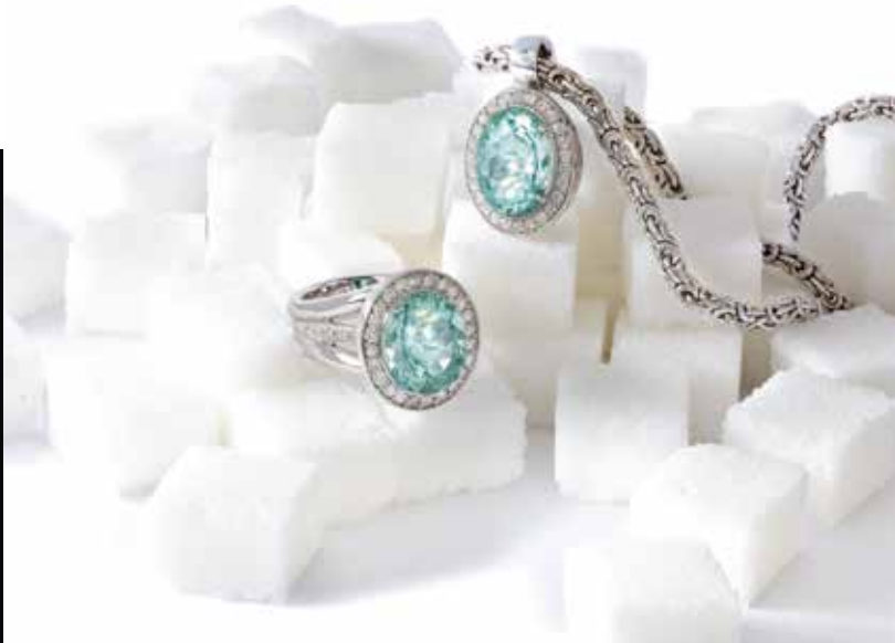
Paraiba-Tourmaline in Weißgold mit Brillanten als hypnotischer Blickfang