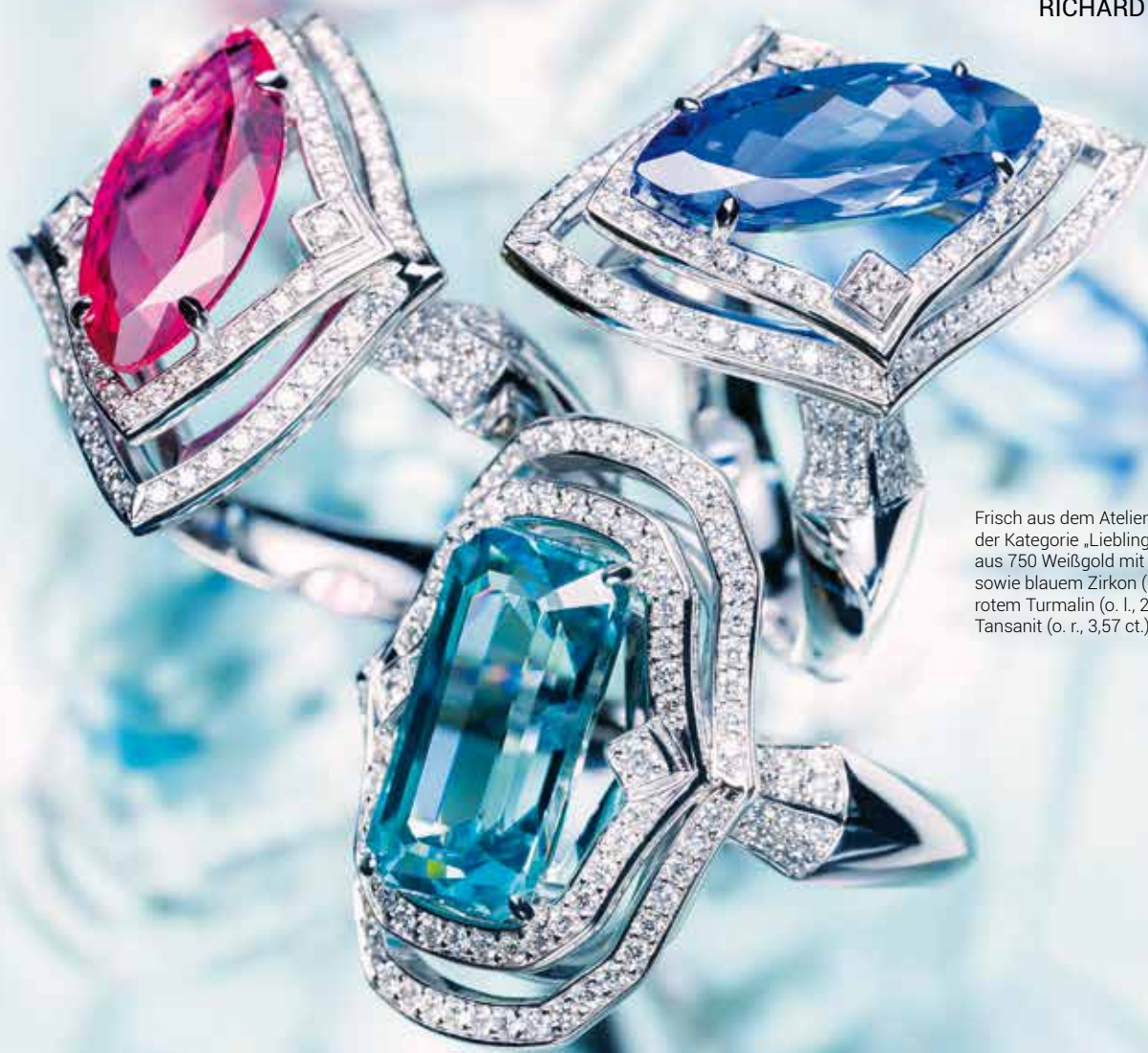
Frisch aus dem Atelier: Drei Ringe der Kategorie „Lieblingsstücke“ aus 750 Weißgold mit Brillanten sowie blauem Zirkon (u., 7,65 ct.), rotem Turmalin (o. l., 2,40 ct.) und Tansanit (o. r., 3,57 ct.)