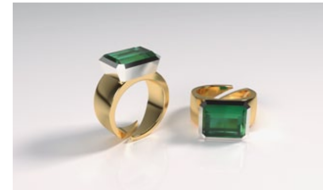
Beispiel für den Ablauf einer Kundenanfertigung: fotorealistisches Renderbild zur Abstimmung (o.), roher Guss mit Kundenstein (M.) sowie fertiges Schmuckstück (u.)