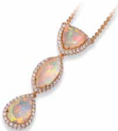
Das Vintage-Collier aus 18 Karat Roségold mit Opalen und Brillanten entführt in die faszinierende Welt der Farbsteine.