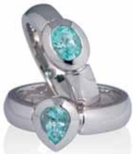
Die Ringe aus 18 Karat Weißgold mit Paraiba-Tourmalinen entstammen der beliebten Linie „Just Simple Mini“.