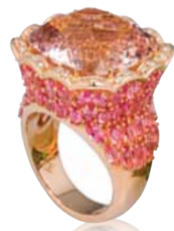
Mit Morganit und Spinellen überzeugt dieser Ring aus 18 Karat Roségold aus der Kollektion „Royal“.