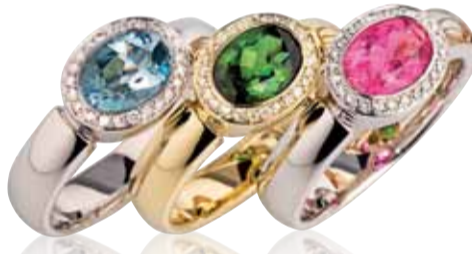
Auch diese Ringe aus 18 Karat Weiß- und Gelbgold mit Aquamarin und grünem und pinkfarbenem Tourmalin sind „Just Simple Mini“.