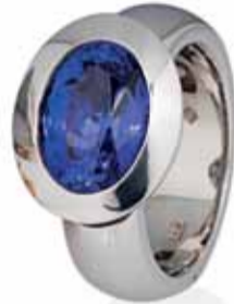
Dieser Ring aus 18 Karat Weißgold mit Tansanit wird der Linie „Just Simple New Generation“ zugeordnet.