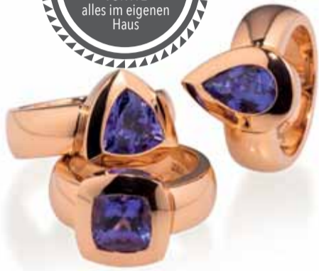
Große Nachfrage verzeichnet die Kollektion „Just Simple petite“. Hier: Ringe aus 18 Karat Roségold mit Tansaniten.