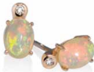
Der Opal ist auch bei diesem Ohrschmuck, gemeinsam mit Brillanten und 18 Karat Roségold, tonangebend.