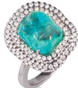
Aus der Kollektion „Sculptures“ stammt dieser Ring aus 18 Karat Weißgold mit Paraiba-Tourmalin und Brillanten.