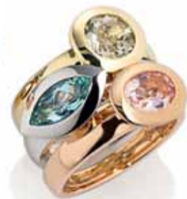
Gefasst in 18 Karat Gelb-, Weiß- und Roségold sind Morganit, grüner Beryll und Mintquarz. Ringe aus der Kollektionslinie „Triple“.