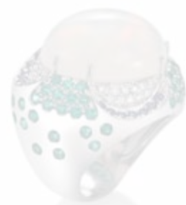
Ring von Mangiarotti aus Weißgold 750 mit Opalstein, Diamanten, Saphiren und Smaragden

Man trägt ihn!!! Bei Verunreinigungen kann man ihn kurz mit lauwarmem