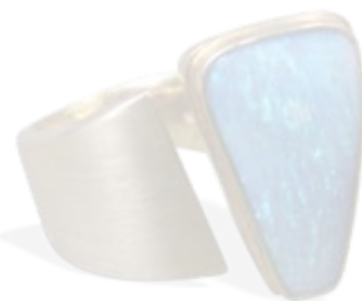
Galerie und Goldschmiede D'OR, Ring „Font“ aus Gelbgold 750 mit Opal