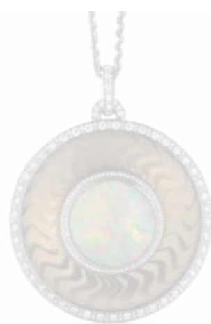
Victor Mayer, Kette mit Amulett aus der „Opera“-Kollektion, Einzelstück, Weiß- und Gelbgold 750, australischer weißer Opal (14,47 ct), Brillanten (2,16ct), Diamanten im Rosenschliff (1,56 ct), Feueremaille

Anfang des letzten Jahrhunderts galt Idar-Oberstein als das Opalschliffzentrum. Auch heute noch sei die Edelstein-Hauptstadt Deutschlands für wirklich feine Edelopale unumgänglich, so Hans Joachim Becker: „In günstigen Drittländern lässt die Schleifqualität oft noch zu wünschen übrig. Deshalb bekommen Edelopale in Idar-Oberstein oft wortwörtlich den ‚letzten Schliff‘.“ □