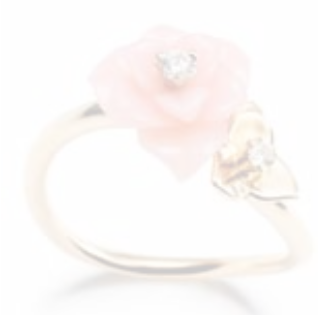
Piaget, Ring Piaget „Rose“, Roségold 750, rosafarbener Opal, Diamanten