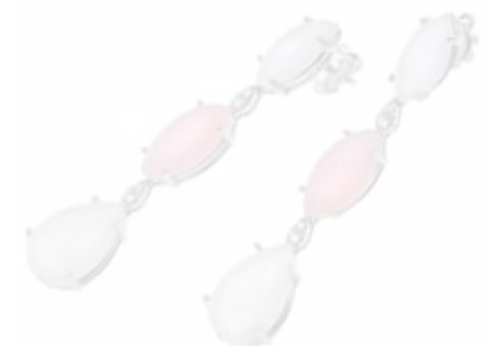
Capra, Ohrhinge aus der Kollektion „Navette“, Weißgold 750, weiße Jade und rosafarbene Opale, Diamanten